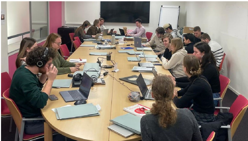
Eén van de werkgroepen van Onderzoekslab verdiept zich in de 19e en vroeg 20ste eeuwse geschiedenis van de Christelijke Normalschool de Klokkenberg.

In ons archief maken scholieren en studenten kennis met bronnen die de geschiedenis van hun eigen omgeving vertellen. We ontvangen basisscholen, middelbare scholen en studenten van het ROC, de HAN en de Radboud Universiteit (RU). Een jaarlijks hoogtepunt hierin is het Onderzoekslaboratorium voor tweedejaarsstudenten geschiedenis van de RU. Onder begeleiding van verschillende docenten doen de studenten gedurende twee maanden hun eerste onderzoekervaringen op in de archieven en collecties van het RAN. Noemenswaardig is verder dat we op 17 april bijdroegen aan een educatieve dag over de watersnood in Maas en Waal. We toonden bronnen uit de archieven van onder meer Wijchen en de voormalige gemeente Dreumel. In totaal, inclusief verschillende activiteiten die voor iedereen toegankelijk waren, werden er iets meer dan 2.000 educatieve bezoeken aan het RAN gebracht.