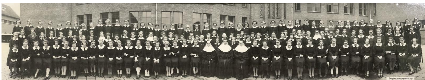
Groepsfoto Mater Dei

We maakten in 2023 een aantal particuliere archieven toegankelijk. Hieronder twee archieven van schoenfabrieken (Wellen & Co en Swift & Robinson) die een beeld geven van het industriële verleden van Nijmegen. Daarnaast voerden we een verandering in ons beleid ten aanzien van het aannemen van nieuw particulier archief door. Sinds begin 2023 is er een maandelijks spreekuur verwerving in het RAN. Op deze manier wordt het aanbod veel meer dan voorheen geclusterd: voor de klant duidelijker en voor het RAN een efficiëntere werkwijze. Het spreekuur levert mooie aanwinsten op. Zo kregen we bijvoorbeeld een ingelijste en haarscherpe 'panorama' groepsfoto van leerlingen en Ursulinen van Mater Dei uit circa 1944 in eigendom. Verder dook er onder andere een notulenboek met inliggende stukken van de Nijmeegsche Bioscopen Vereniging op (1945-1976).