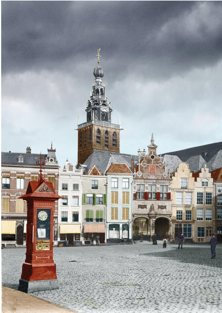
Ingekleurde oude foto Grote Markt Nijmegen